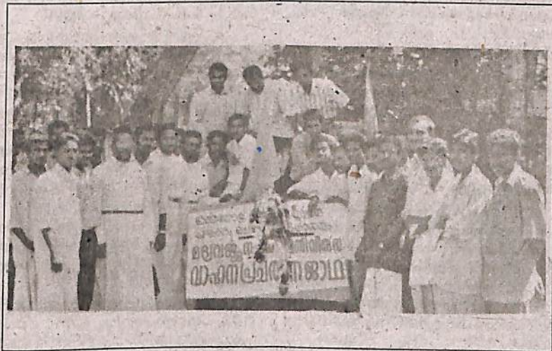
അഴിമതി വിരുദ്ധ മദ്യവർജ്ജന വാഹനപ്രചരണജാഥയ്ക്ക് കൂട്ടംപേരുരിൽ നൽകിയ സ്വീകരണം.

മദ്യത്തിനും അഴിമതിക്കുമെതിരെ പോരാടിയ മഹാത്മാഗാന്ധിയുടെ ജയന്തിദിനത്തിൽ ഈ സന്ദേശവുമായി രംഗത്തിറങ്ങുന്നതിൽ ഞങ്ങൾക്കു സന്തോഷമുണ്ട്. ഇന്ന് കാക്കകൾക്ക് കാഷ്ടിക്കുവാനായി പൊതുനിരത്തിൽ വച്ചിരിക്കുന്ന ഗാന്ധിപ്രതിമയ്ക്കു താഴെ മദ്യപാനവും അക്രമവും നടക്കുന്നു. സർക്കാരാഫീസിൽ ചില്ലിട്ടു സൂക്ഷിച്ചിരിക്കുന്ന ആ ചിത്രത്തിനു താഴെ കൈക്കൂലിയും അഴിമതിയും അനായാസം നടമാടുന്നു. ഇതിനെതിരെ ഒരു